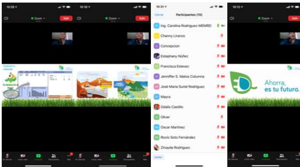
Charla virtual: “Ahorro de Energía y Agua”, ofrecida por el Ministerio de Energía y Minas al personal de esta Superintendencia de Pensiones.