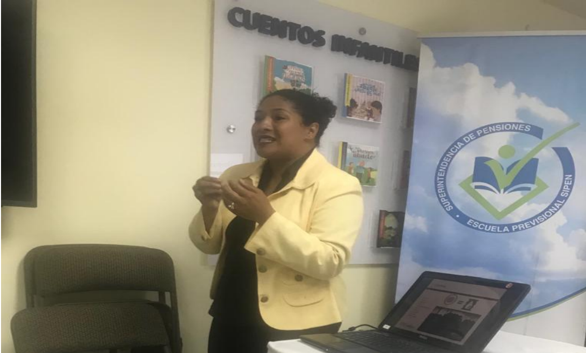
Charla ofrecida por la empresa Green Love, a los colaboradores de SIPEN, sobre el reciclaje y la correcta clasificación de los desechos.