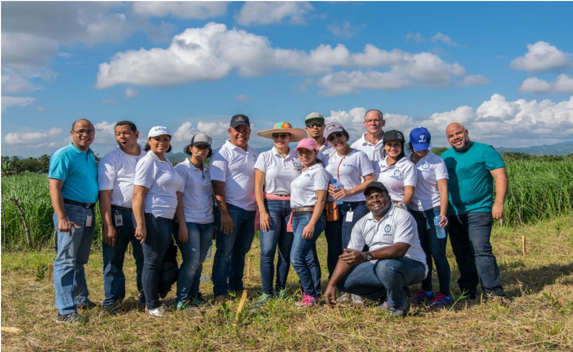
Servidores de SIPEN, desempeñando su labor de Reforestación, en la Autopista 6 de Noviembre.