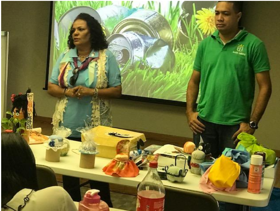
Taller impartido al Personal SIPEN, por el Ministerio de Medio Ambiente y el Ayuntamiento del Distrito Nacional, sobre la utilización de Materiales Reciclados.