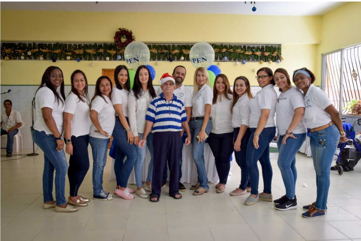
Visita al Hogar de Ancianos San Francisco de Asís.