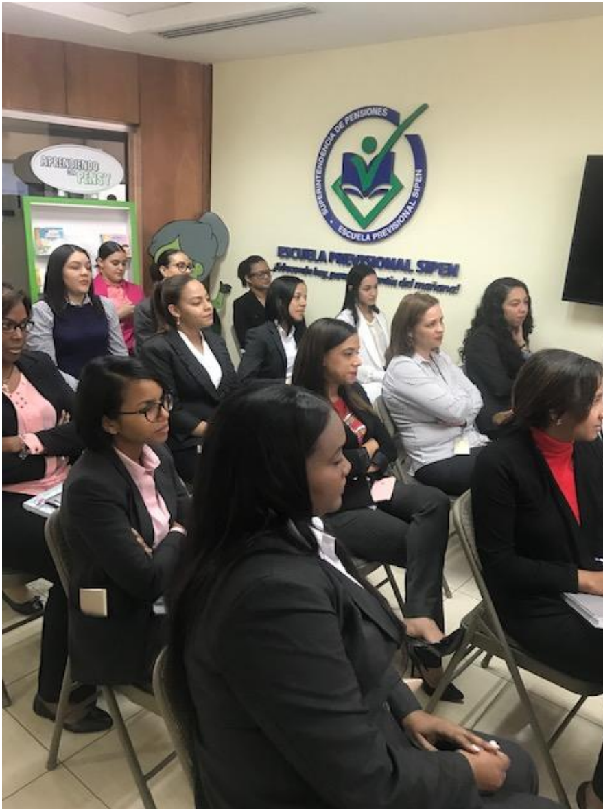
Colaboradores de la SIPEN participando en la charla “Buen Trato a las Personas con Discapacidad”, impartida por representantes del CONADIS.