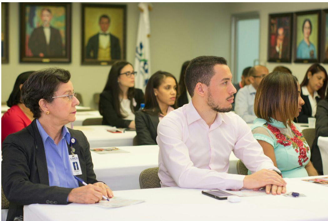
Colaboradores de la SIPEN participando en la charla “Formación de Formadores en Buen Trato Familiar y de Género”, impartida por representantes del Despacho de la Primera Dama.