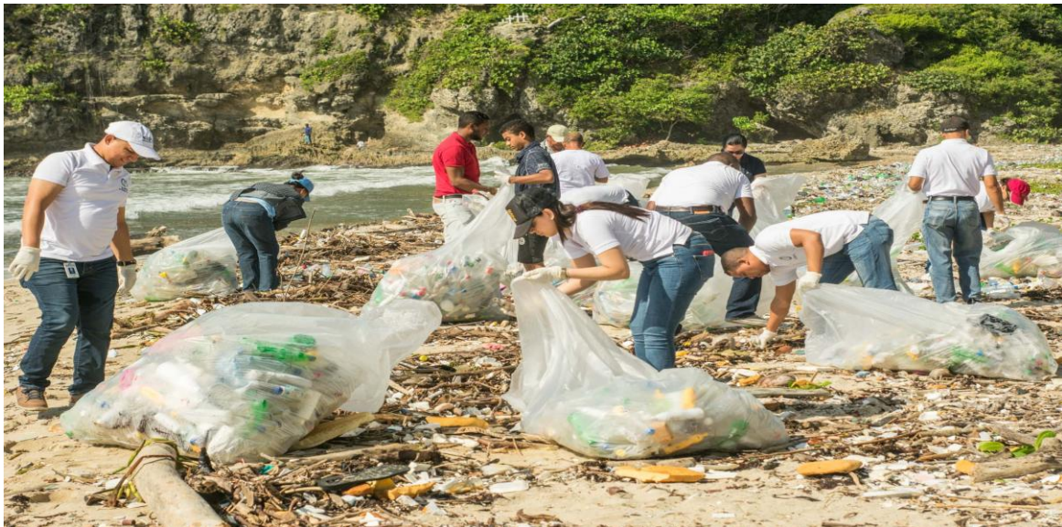
Personal de la SIPEN desempeñando su labor como colectores de desechos sólidos en la 2da. Jornada de Limpieza de Costas, realizada en la Playa Carlos Pinto en Najayo, Provincia San Cristóbal.