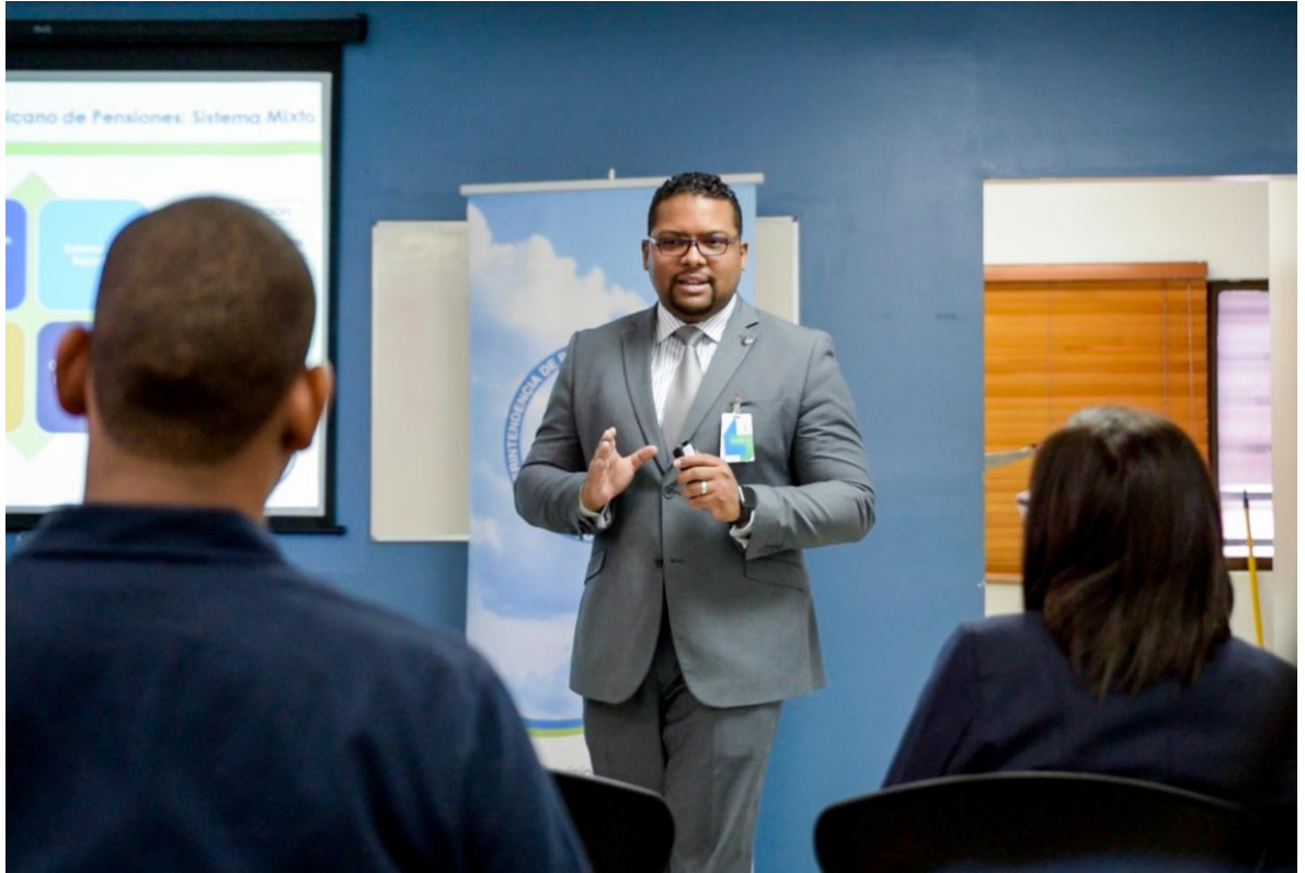
Charla impartida en el Ministerio de Energía y Minas, sobre “Deberes y Derechos ante el Sistema Dominicano de Pensiones”.