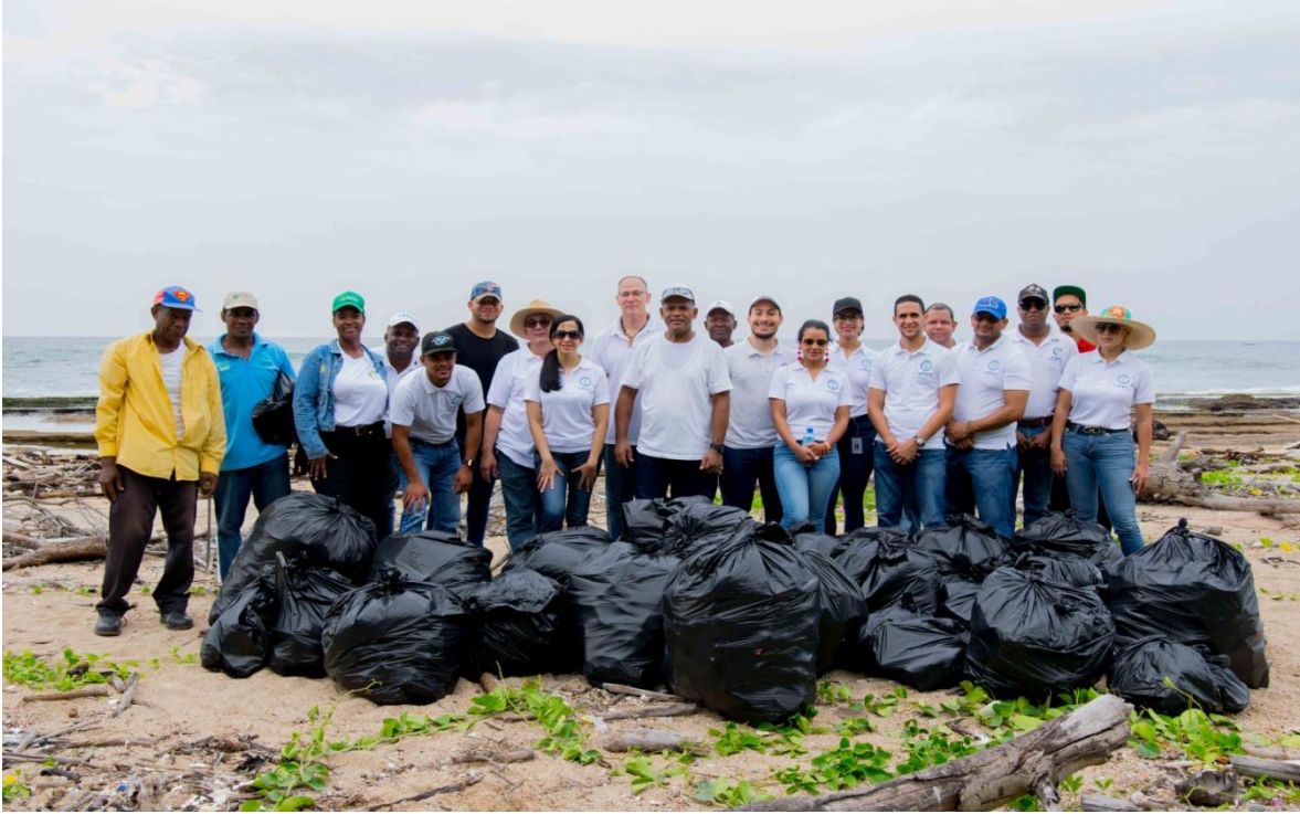
1er. Grupo de Colaboradores de la SIPEN, que participaron en la Jornada de Reforestación, realizada en el Parque Ecológico de Nigua, Provincia San Cristóbal.