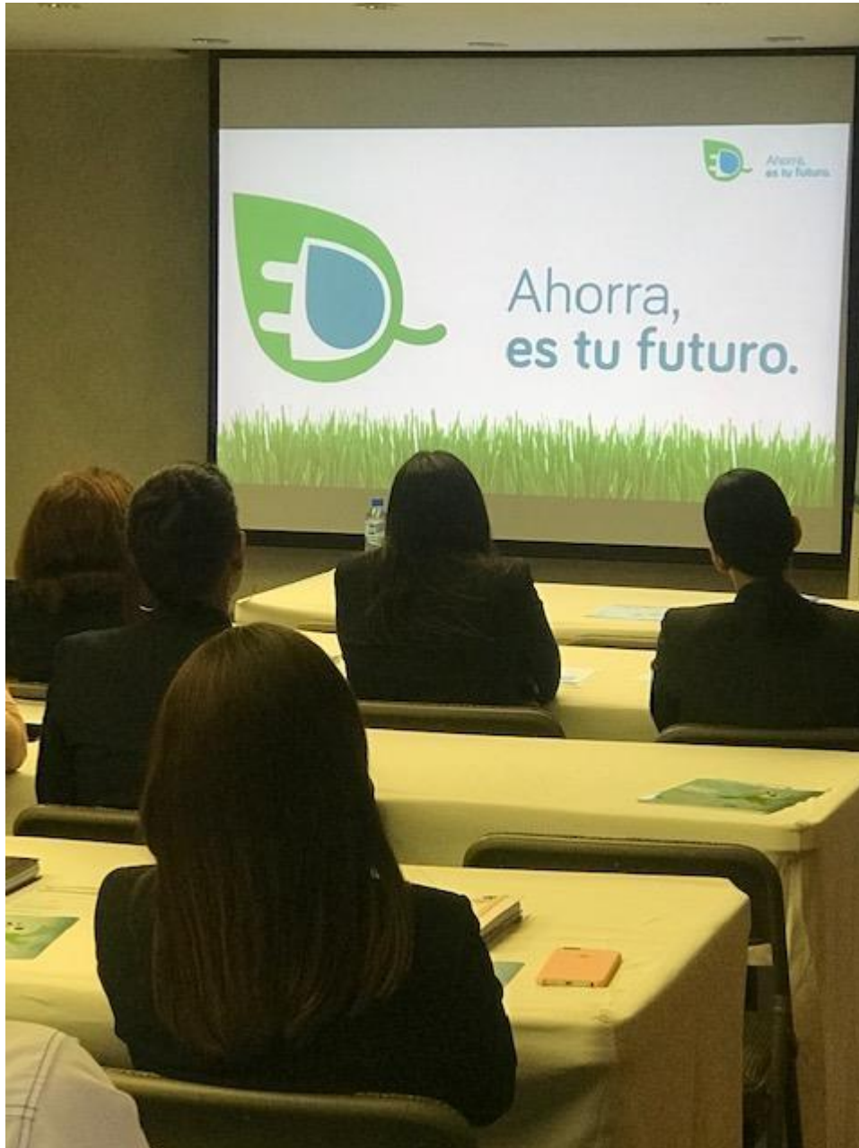
Charla ofrecida por el Ministerio de Energía y Minas al personal de esta Superintendencia de Pensiones, sobre el “Ahorro de Energía y Agua”.